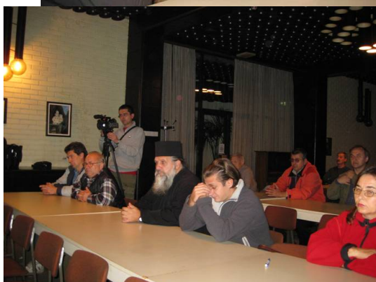
Обновљиви извори у свету 2005